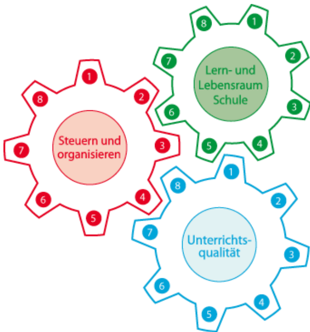
Abb. 2: Zahnrad-Modell der Handlungsfelder der Bewegten Schule Niedersachsen

Das vom Niedersächsischen Kultusministerium geförderte und von der Fridtjof-Nansen-Schule Hannover sowie dem Gemeinde Unfallversicherungsverbund / Landesunfallkassen Niedersachsen e. V. sowie der LVG & AFS Nds. e. V. umgesetzte Projekt verfolgt das Ziel, Bewegung in das gesamte System Schule zu bringen.